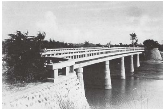
九十七號福興鄉 員大排水路下游部福鹿大橋