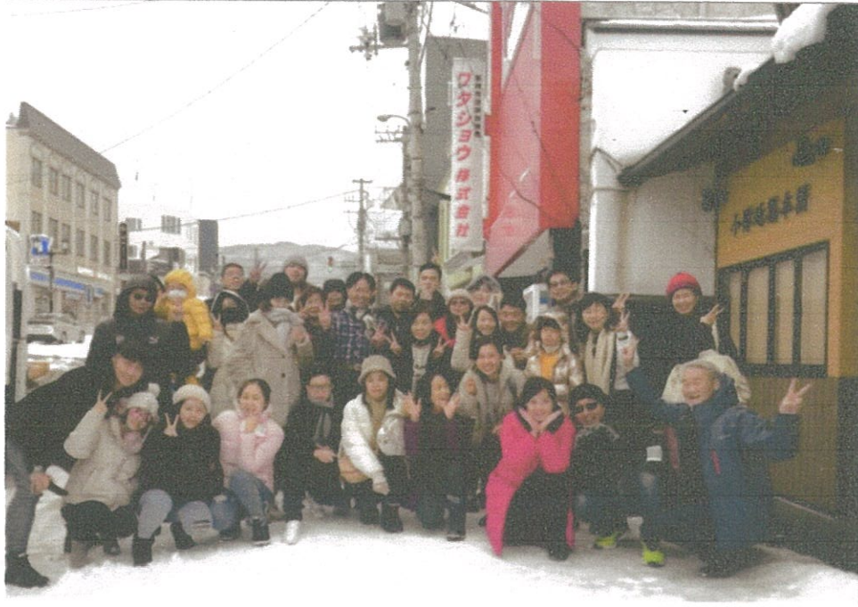
雪戀北海道我們的團員