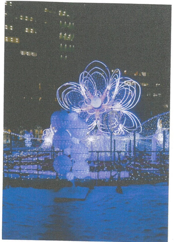
札幌的聖誕應景燈飾