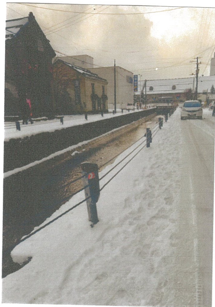
整理後的運河應該說是一條河了