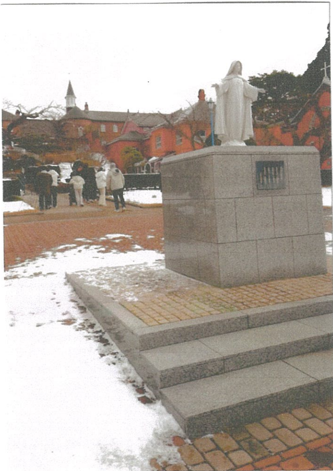
百年修道院保存完好