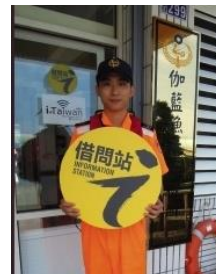
# 台東 伽蘭安檢所