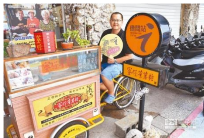
# 小琉球蜜仔番薯糖