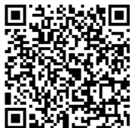
陳情意見表電子表單