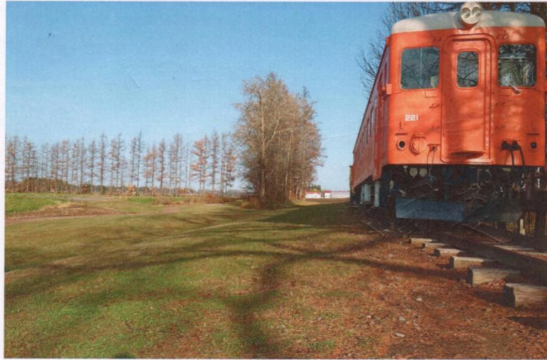
幸福車站的綠美化