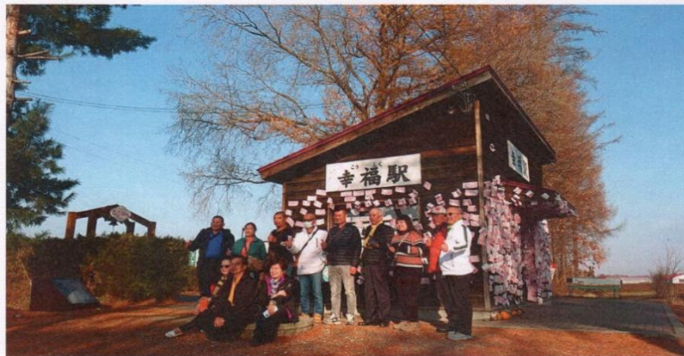
幸福車站的遊客留言牆