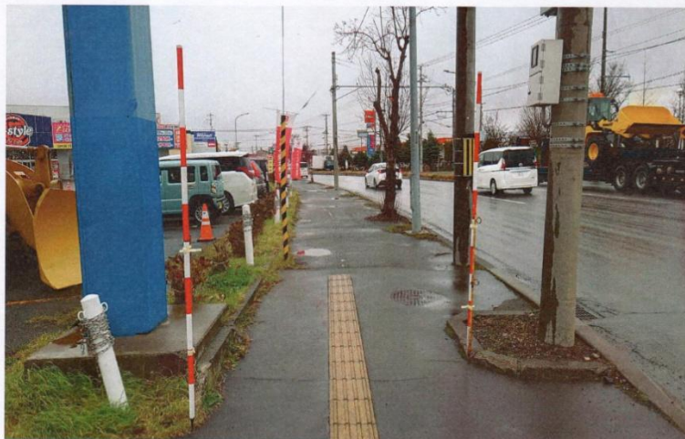
積水或積雪時用來標示提醒路人的標竿