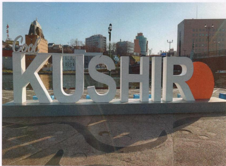
釧路河上的大型地名文字