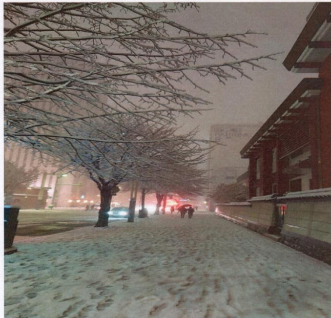
札幌人行道上路樹街景