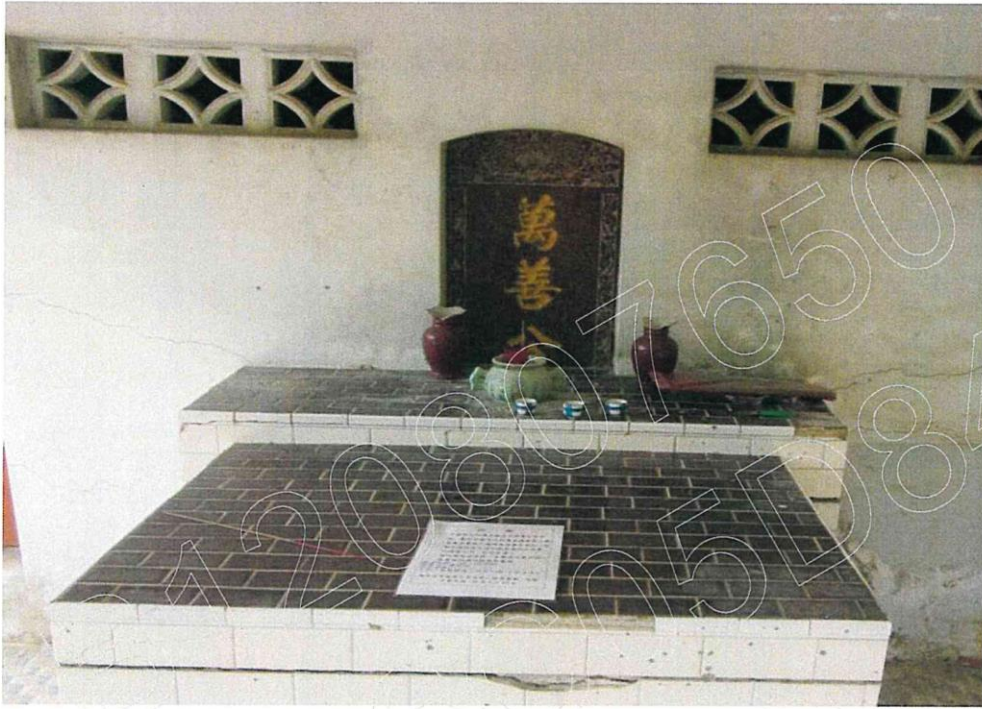
萬善公墓屋現況照片