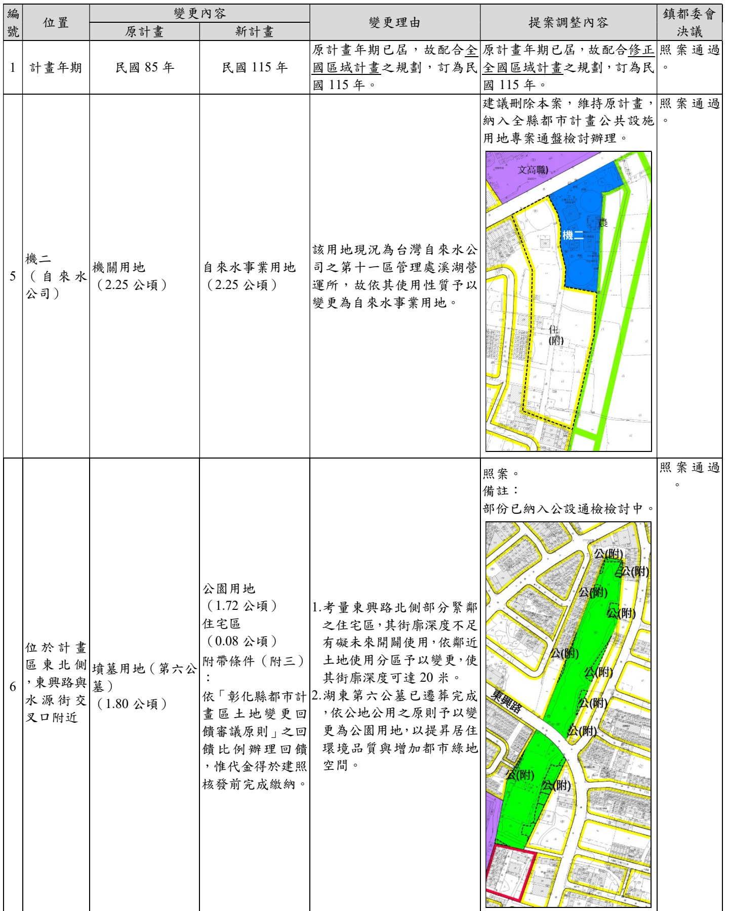
表 1 變更內容明細表