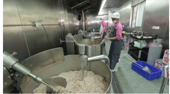
6.生產或加工場域照片