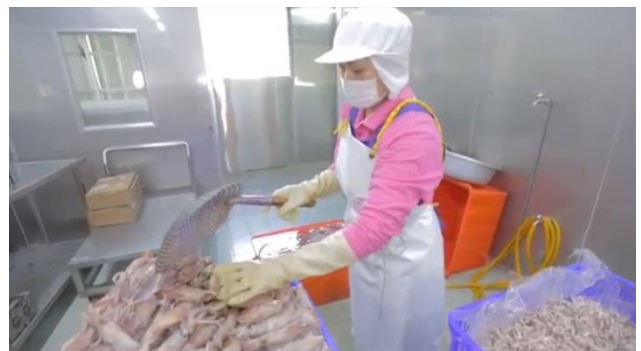
6.生產或加工場域照片