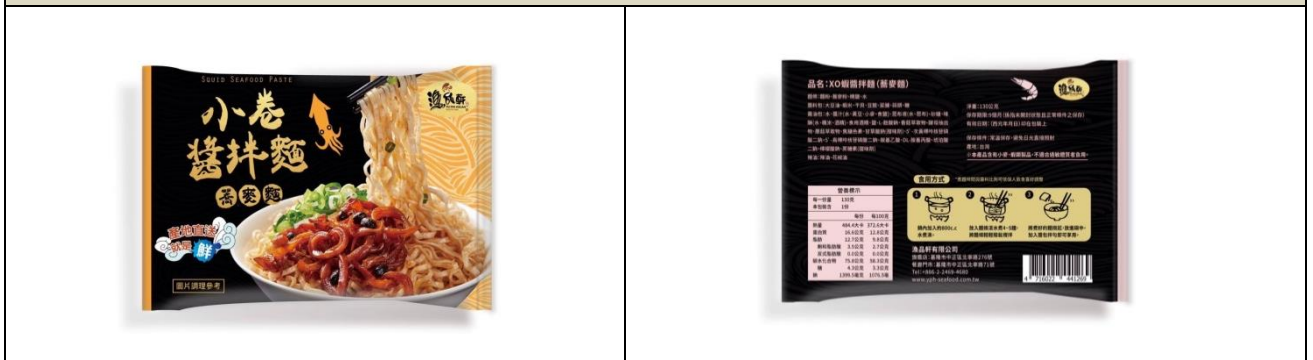
2.完整包裝產品(內包裝)正反面