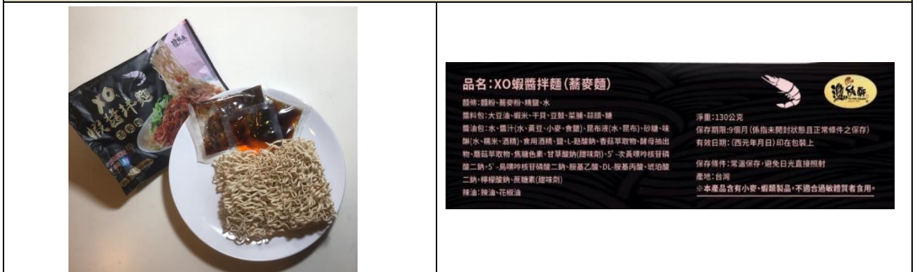
3.未包裝產品內容物