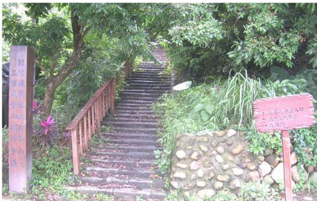
◆萬里長城步道員南路三百崁入口。