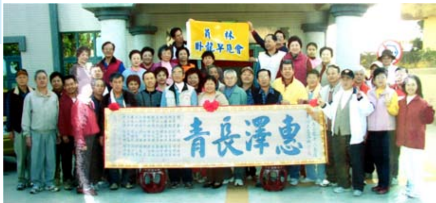
◆員林臥龍早見會2007年1月合影。