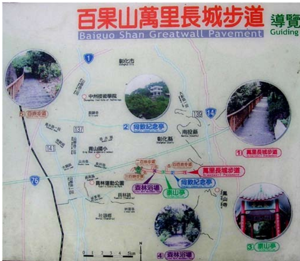
◆百果山萬里長城步道導覽圖立在員南路二百崁、三百崁、四百崁入口。

柴頭井有好幾株大樹成爲最佳路標，林厝交流道西方劉厝圍牆外的大樟樹，山腳路東側的印度橡膠樹，員南路藤山步道的廣東油桐（千年桐），臥龍坡頂的相思和樟樹，果園中的荔枝老樹和龍眼叢，都是歲月見證者。麻雀、燕子、五色鳥、烏鶯、斑鳩、粉紅鸚嘴、白頭翁、蟬、灰面鷺、大冠鷺、綠繡眼、青笛仔等，吱吱又喳喳，交織在各種蜂蝶與果香間！林厝里大部爲坡地產水果，蜜餞廠也不少，北端一鄰就是泉州寮。一整片荔枝林，百年荔枝樹好幾株，挑起員林「水果故鄉」重擔。