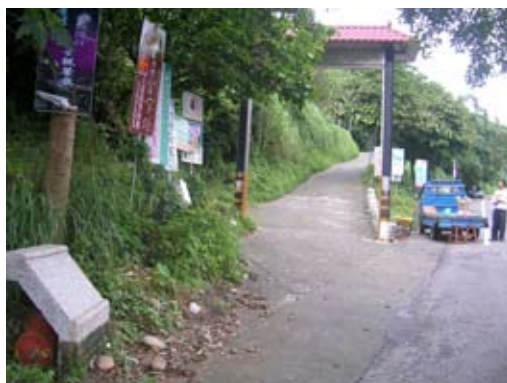
◆萬里長城步道員南路四百崁入口。