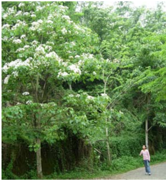
◆藤山步道春季油桐花海一景。

一看破」、「傳家佛經—世世唸」、「做牛著拖，做人著磨」、「人情留一線，日後好相看」、「好天要積雨來糧」、「掠雞寄山貓—有去無回」、「有應公童乩—講鬼話」、「九月風颳—慘歪歪」等，許多民眾登山學俚語，忘了揮汗如雨的爬山辛苦。環境教育促進委員會理事長黃明權表示，兩年來逐步嘗試掛牌，沒想到民眾熱情響應，因此2007年籌足經費後，把原本簡單掛牌，改製成五十面固定木製俚語牌，寓教於樂，十月辦理研習會，增添不少休閒樂趣。