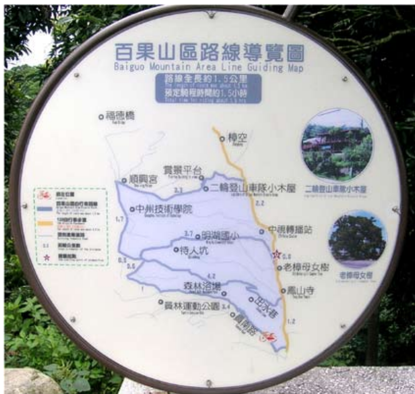
◆臥龍坡頂設立百果山區路線導覽圖。

由於油桐樹淺根脆枝，油桐花籽多且輕，風一吹四處飄散，炭根快容易生長，因此繁衍迅速。近幾年，尤其是「藤山」和「臥龍坡」處處開滿油桐花，形成百果山美麗的景觀，逐漸受到重視。近年，彰化政府、員林鎮公所、地方團體、在地人士等多方努力合作，全面規劃完整的步道並修建完善的休閒設施，今日已是百果山上重要的健康休閒區域了。