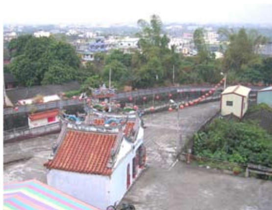
◆從明聖宮三樓向右前鳥瞰林厝里，左前俯視社頭鄉協和社區，圖為1984年從霖肇宮分香興建的舊明聖宮。

1994年明聖宮大廟落成後，有個里民心直口快，笑稱神尊靈嗎？沒想到隔天一大早，明聖宮乩童突然起乩，兩乩手持鸞轎仔激烈抖動停不住，赤身乩童扶著被神尊上身的鸞轎仔，廟前廟後狂撞，多位里民向前齊拉卻拉不住，只見兩乩扶鸞轎仔直衝廟後坡地的刺竹叢，那片年久無人接近的刺竹叢，只要靠近全身會被密密麻麻的竹刺刺傷，里民跟隨至此全嚇呆，眼見兩乩竟直奔刺竹叢，里民拉不回頭，只見兩乩穿過刺竹叢後直衝該里民住宅，鐵門雖緊閉仍被乩童撞開衝入，眾里民繞道趕至現場，個個嘖嘖稱奇，聲稱「三山國王顯靈」，這段歷歷在目的往事，成為林厝里鄉野趣聞。