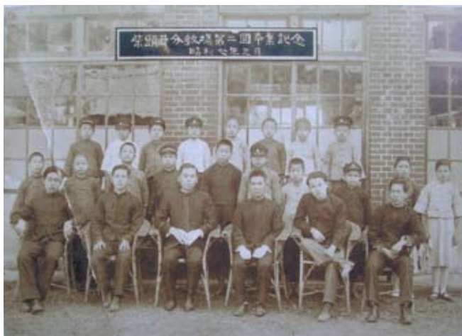
◆柴頭井分教場1932年3月卒業記念。

族群聚落發展的脈絡，公墓保留不少足跡可循，《員林鎮志》記載員林早年六處公墓共63.8公頃，21.7公頃三塊厝埔第一公墓（今鎮興里），16.9公頃東山埔第二公墓（今南東和東北里），15.5公頃柴頭井埔第三公墓（又叫坡姜林埔，今林厝里），3.6公頃火燒庄埔第四公墓（今大明里南區公園），4.65公頃大埔厝埔第五公墓（今大埔公園），1.4公頃三角潭埔第六公墓（今源潭環保公園）。這六處公墓陸續公園化，遷葬後設納骨塔，唯柴頭井埔仍保留民間土葬習俗。此外，還有百果山麓的薑母山、大崙坑埔、萬年埔等，仍有許多先民古墓，供後人追思。