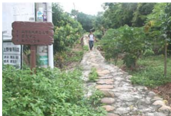
◆萬里長城步道員南路二百崁入口。