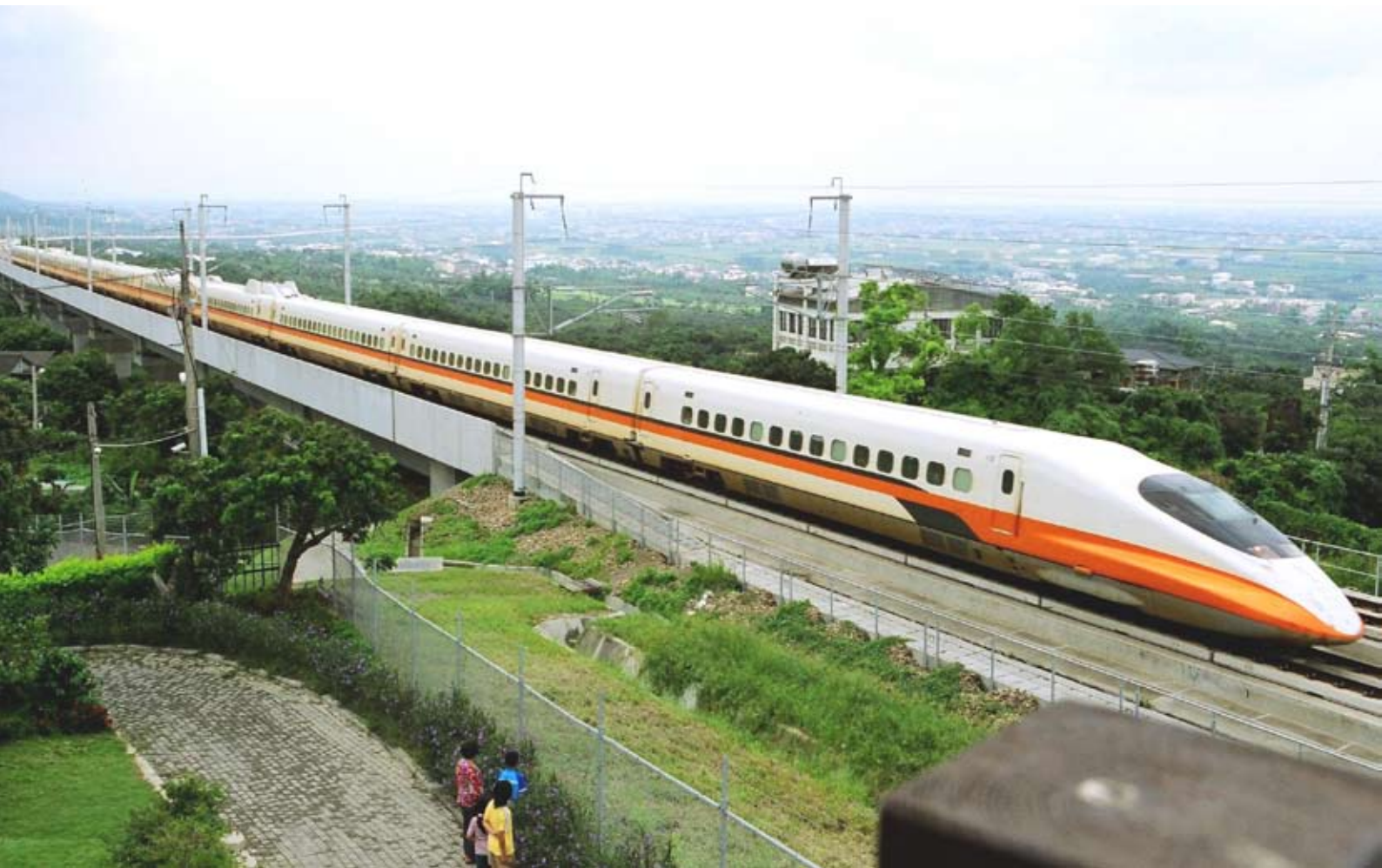
◆台灣高鐵南下穿越百果山林厝段和社頭交界處英姿。

縱然2007年員林地政所調整草案中公布，員林鎮最高地價在中正路與民生路交叉口，每平方公尺21.8萬元降為17.6萬元，最低地段在柴頭井段山地，每平方公尺由九百元降為七百元。然而，林厝的人文生活就是百果山的文化風情，林厝之美就是百果山之寶，庸俗的地價如何算計百果山珍貴的自然景觀呢？心動不如馬上行動，邁開腳步從林厝探索百果山，是入寶山的優質門徑！