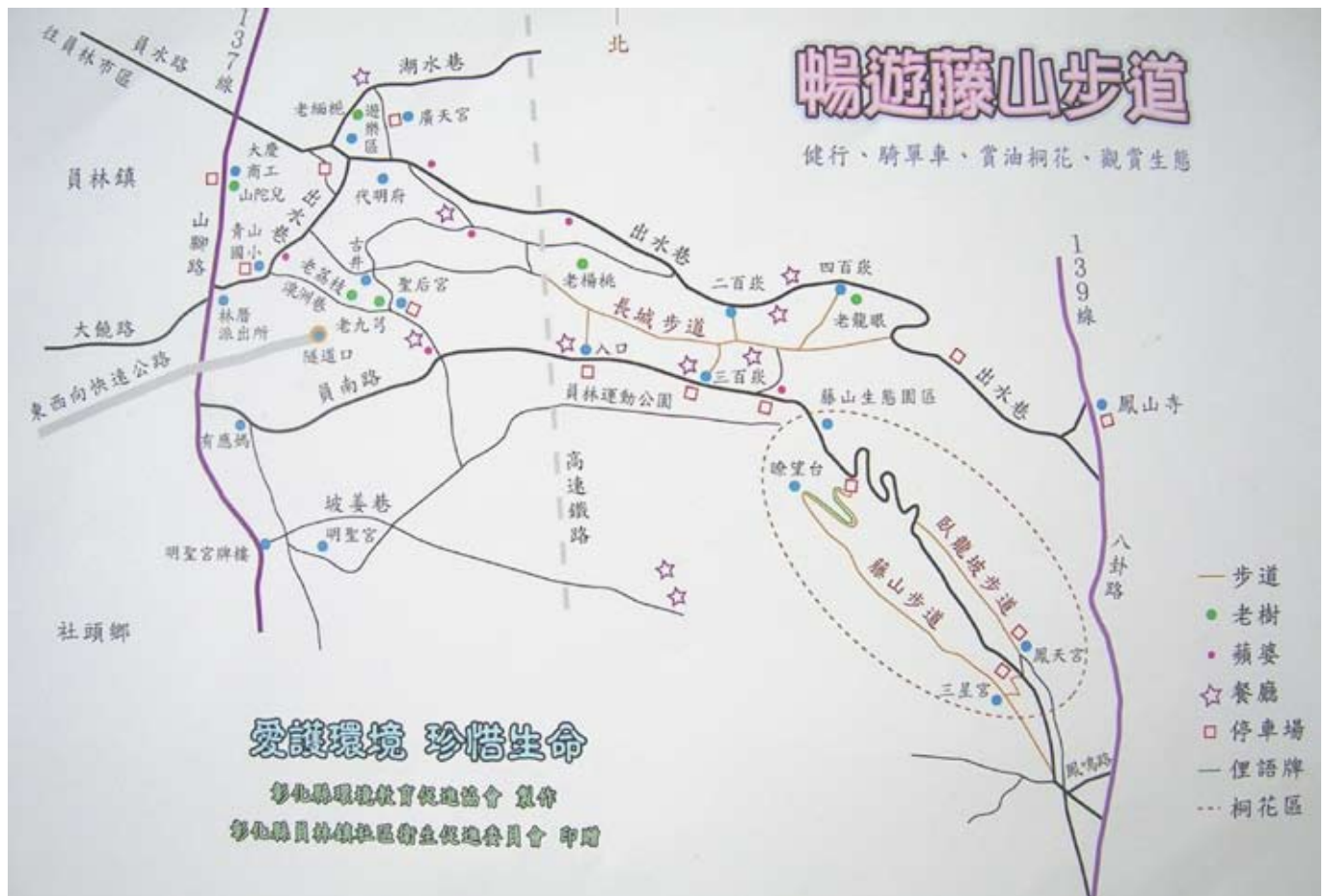
◆百果山步道圖環境教育促進協會繪2007

端樹林，早年在在地人叫做「五汧頭山」，也就是今日「藤山停車場」南面的「藤山步道」樹林，目前乃由余姓等持份管理樹林。