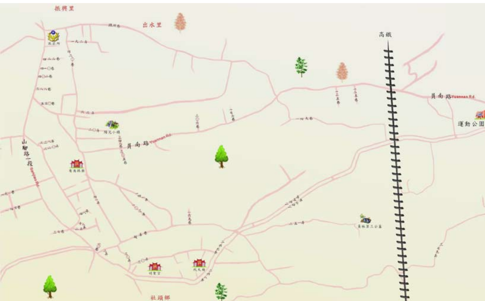
◆員林戶政事務所2003繪製林厝社區地圖。