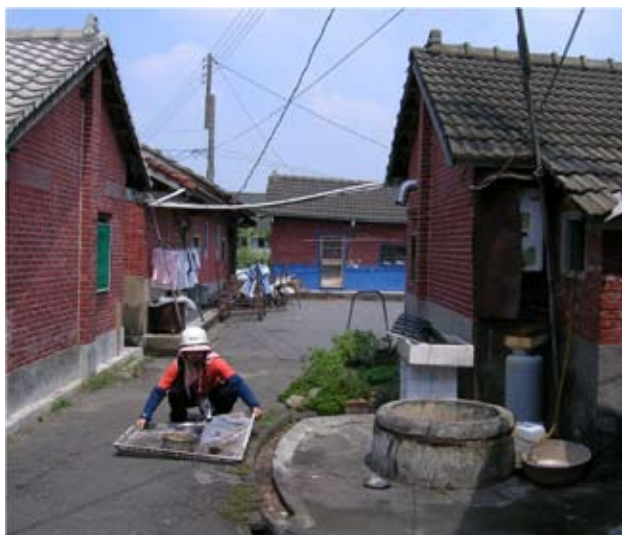
◆百果山麓崙雅里清河堂百年出水古井，1999年九二一大地震時，噴出比屋高的泥砂。