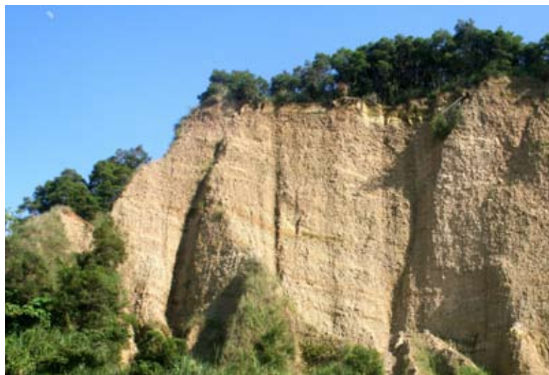
◆員林土層原始風貌之一，位在東山埔上方。