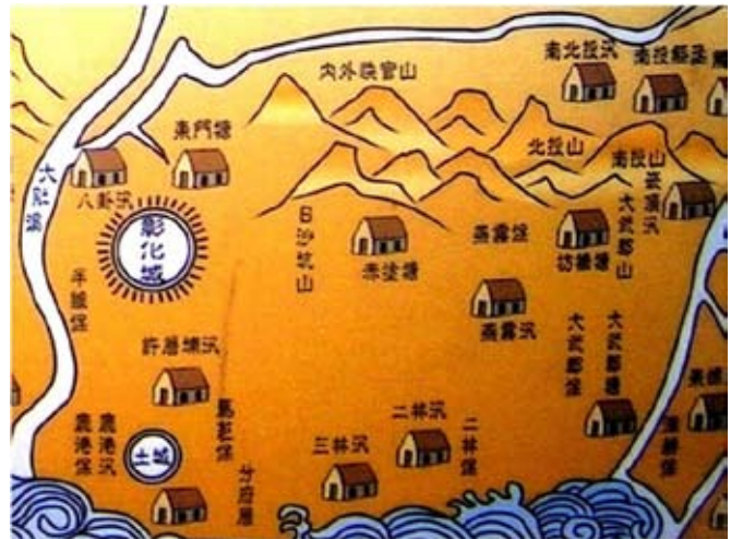
◆ 《彰化縣志》1832年彰化縣山川圖局部。 (楊銘欽2005攝自彰化縣史館外牆，今已塗去)