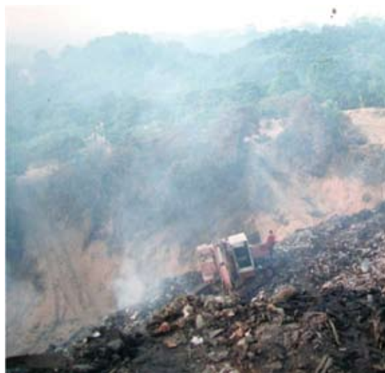
◆員林百果山垃圾場1990年局部的情形。