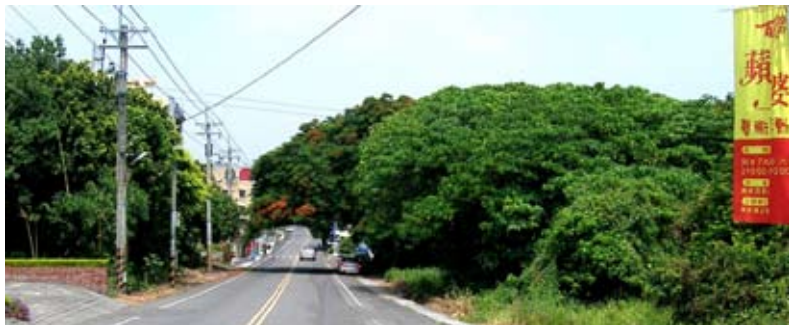
◆員水路向東直抵百果山，兩旁蜜餞廠密佈。

走踏傳說中的林厝遺址，阿都喜憂參半，喜的是台灣古文化之寶座落員林，憂的是開發腳步破壞古文物，忽視遺址維護工作。冥想遠古時代，幾萬年前，這塊原始山林形成久遠，三千七百年前，此地已有人的生活痕跡，雖沒有文字發現，卻但想像原始林生活已有聚落、互動生活方式、狩獵、刀器，甚至有美的飾品和陶器文化。再深度冥想，林厝遺址是否發生不可抗拒災變？原始人要如何求生存？不知道林厝遺址周邊，到底深埋多少史前秘密？亦或是更多不為人知的可能？諸多無限可能存在，讓林厝遺址文化寶藏，宛如臺灣寶鑽，將會是臺灣在世界舞台放光芒的文化重點之一，是我們戮力守護珍貴的文化資產啊！