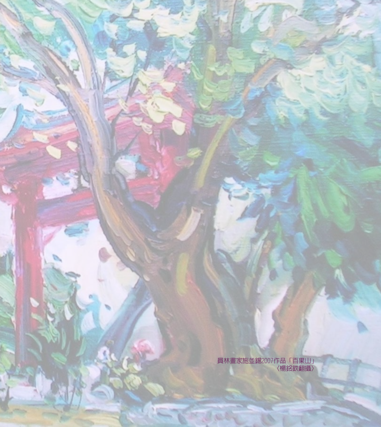
員林畫家施並錫2007作品「百果山」