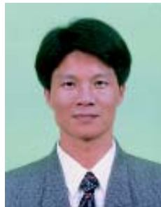
柯東洋 (政事篇) 兼大事紀