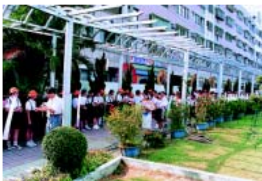
民國九十一年歡送畢業生（一）