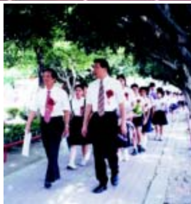
亮麗大同造就無數莘莘學子(第五十屆)