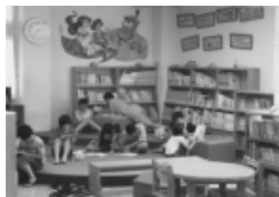
伸港鄉立圖書館兒童室