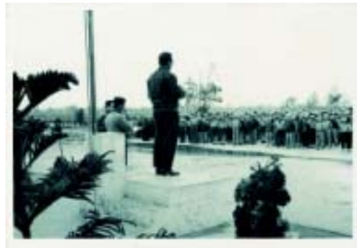
舊司令台