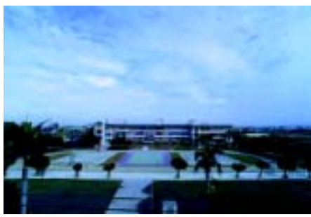
校區全景