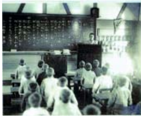
日治時期上課情形