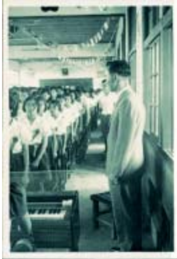
在舊教室舉行畢業典禮