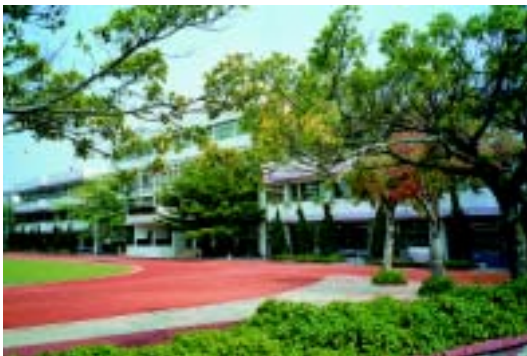
校園建築