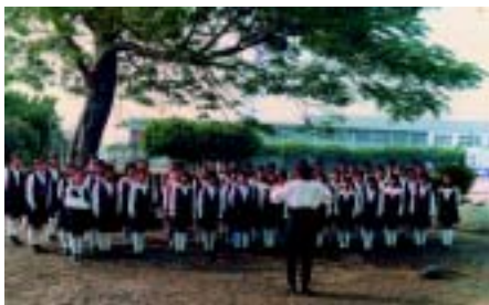
合唱團整裝待發