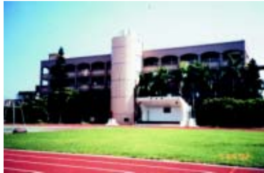
新建大樓