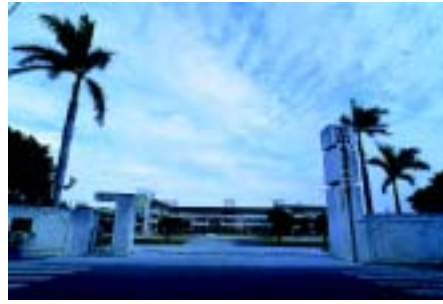
校門(伸東國民小學提供)