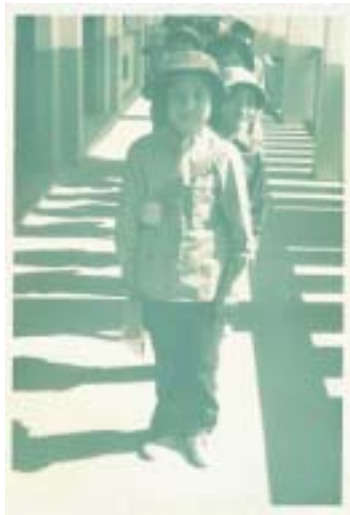
舊教室二樓走廊