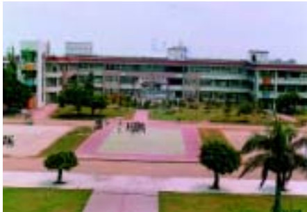
新教室舊操場景觀