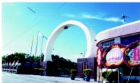
壯觀秀麗的新建校門