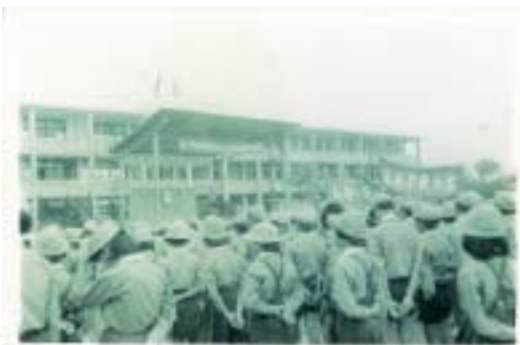
民國六十七年（一九七八）剛遷校成立的校 景（共 24 班）