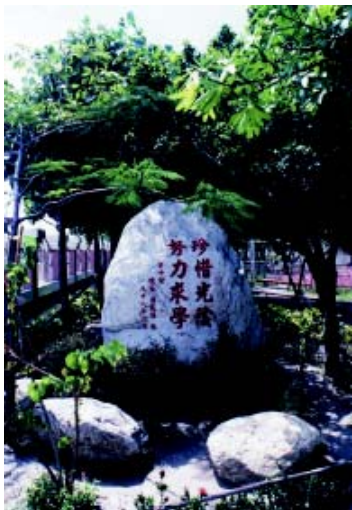
校園勝景 精神堡壘(大同國民小學提供)