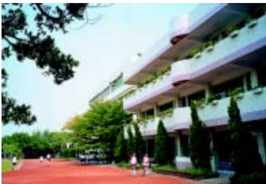
校園建築(伸港國民中學提供)