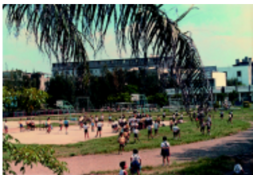
民國七十四年（一九八五）待整建中的校園