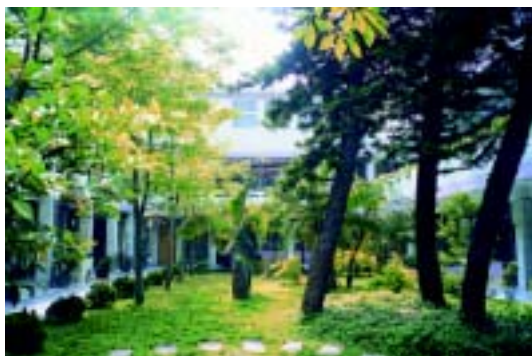
校園綠地