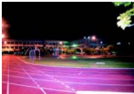
大同校園夜景