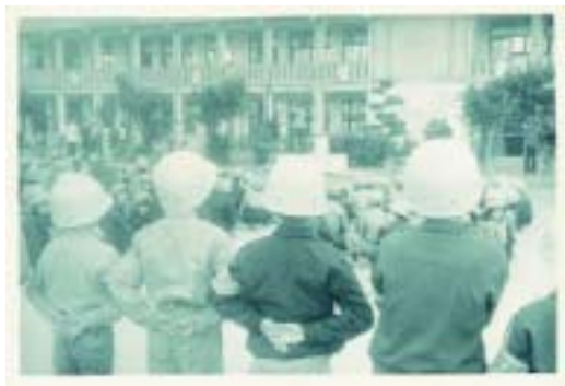
舊教室正面