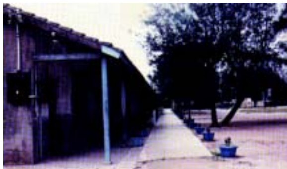
舊日校園風貌