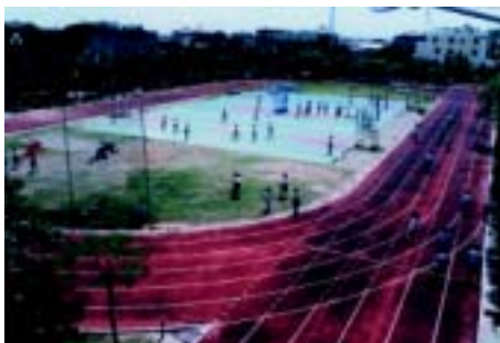
學生競技場 200公尺標準田徑跑道