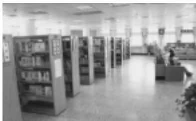
伸港鄉立圖書館書庫