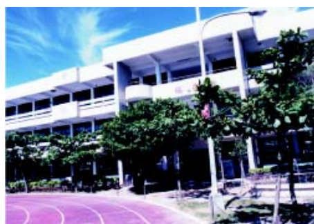
巍峨的現代化校園建築(大同國民小學提供)