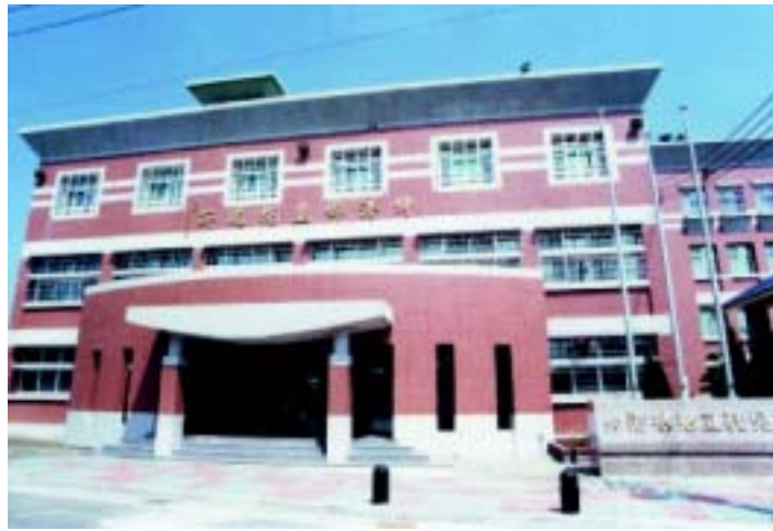
伸港鄉立托兒所

十二 伸港鄉立托兒所資料提供。 十三 何清欽，〈光復初期之台灣教育〉，高雄：復文圖書，民國六十九年，頁五四、六一。