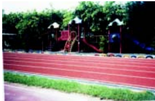
綜合遊戲器材組