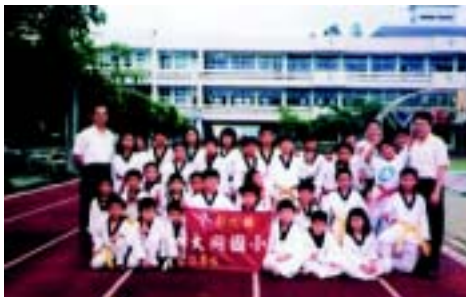
該校運動特色之一 跆拳道隊，佳績頻傳