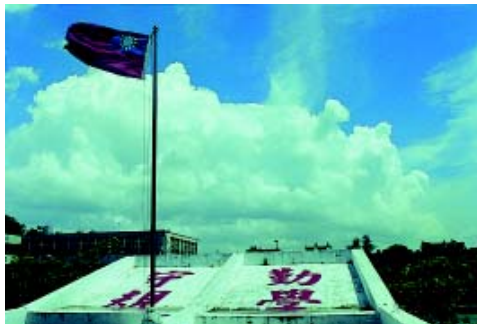
大同校訓 勤學守規