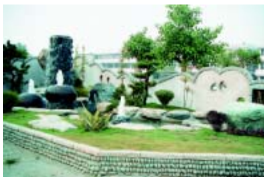
校門造景