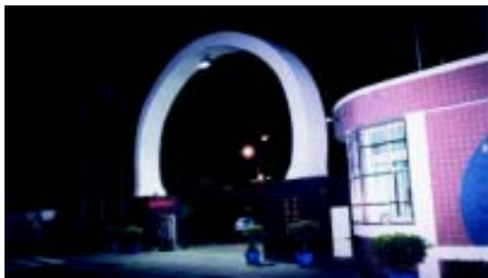
夜色中的大同 明亮耀眼，造型獨特

民國七十五年（一九八六）三月五日，自然增班教室一間。民國七十一年（一九八二）五月十八日，新建兩部制教室四間。民國七十六年（一九八七）二月二十八日，危險教室重建竣工（三間）。民國七十八年七月十五日（一九八九），興建一般教室及專科教室共十七間竣工。民國八十一年（一九九二）九月，新建三樓綜合大樓完工啟用。民國八十五年（一九九六）十二月，新建教室二間、川堂三間。