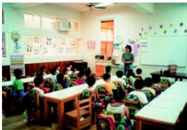
伸港鄉立托兒所上課情景