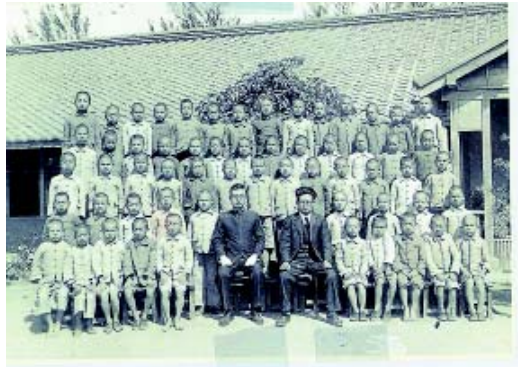
日治時期老師和學生合影