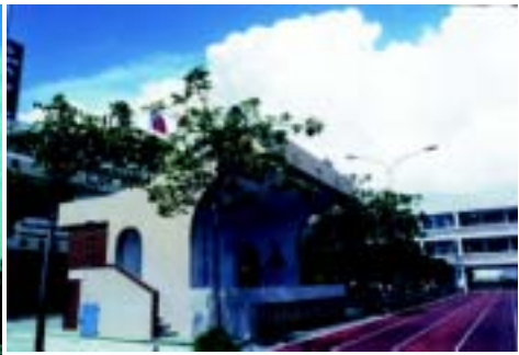
校區發號中心 司令台 (大同國民小學提供)