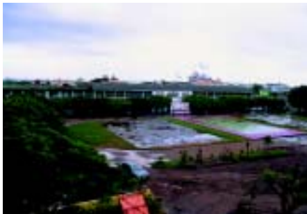
整建中的舊操場