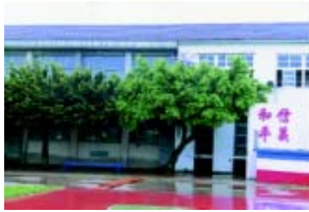
校園舊景