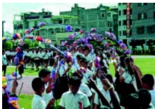
民國九十一年歡送畢業生（二）（新港國民小學提 供）