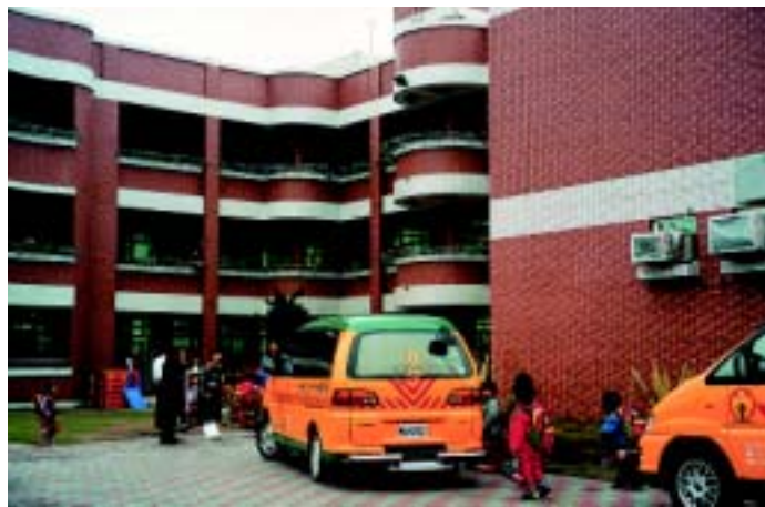
伸港鄉立托兒所接送孩童