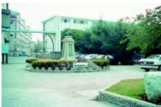
校園舊景