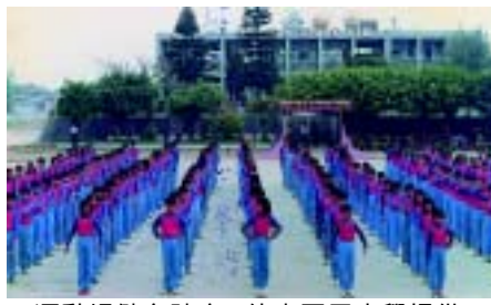
運動場健身陣容