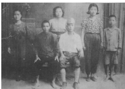
臺籍日本兵

清康熙二十二年（一六八三），清領臺灣，因應不同時空環境，先後施行班兵、屯兵、募兵、鄉勇等兵制。及至日明治二十八年（一八九五），日本依馬關條約佔據臺灣，歷經明治、大正到昭和中期，在臺施行徵兵制。由於臺灣人屢有反日、抗日之舉，故向來不為日本政府所信任，徵兵對象僅為居臺之日本人而已。