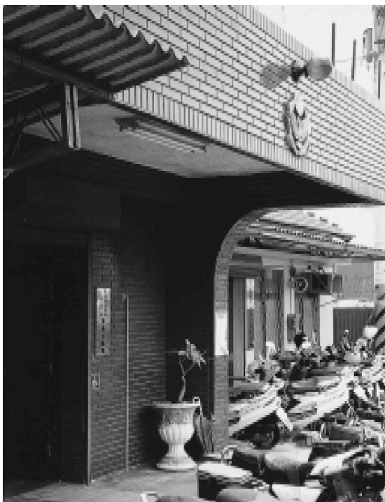
和美分局伸港分駐所

四、加強為民服務、解答疑難、排解糾紛、受理民眾報案與案件申請等各項為服務工作。 五、加強地方行政機關之協調、配合地方人士完成各項警察任務，使社會更安定，地方更繁榮，人民更祥和樂利。