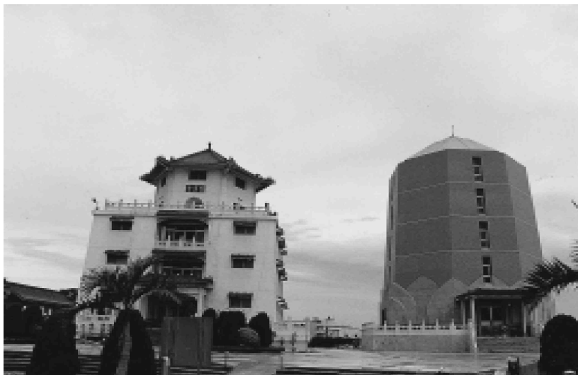
第一公墓納骨塔懷恩堂(圖左)和慈恩堂(圖右)

三年(一九八四)九月二十二日止)有主墳墓自行遷葬，無主墳墓於公告期滿後由鄉公所僱工遷葬，經撿骨、洗骨後裝罈、裝袋，依傳統民俗，延請道士接引生靈，暫厝於臨時納骨堂奉祀。