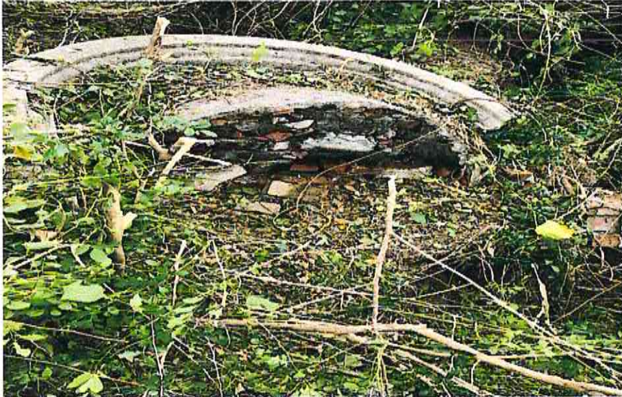
無主墳墓 1 實照圖示