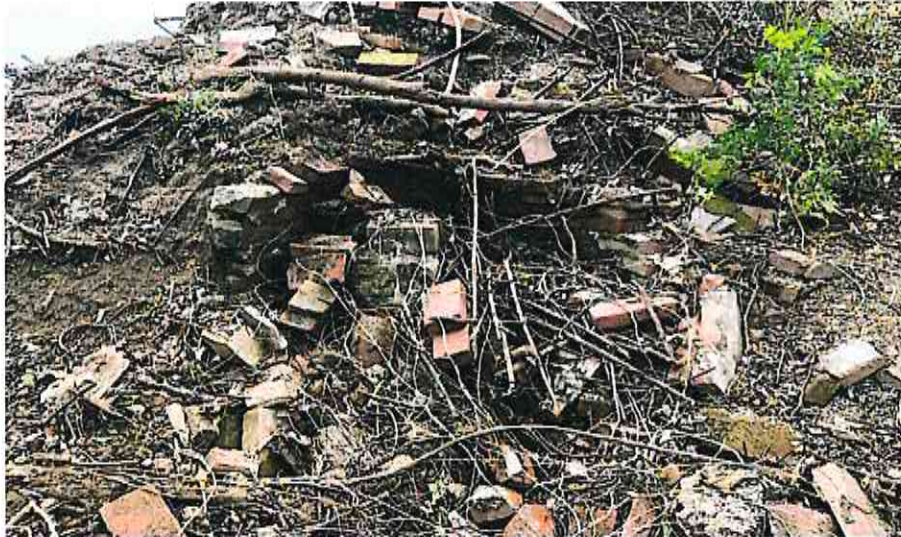
無主墳墓 2 實照圖示